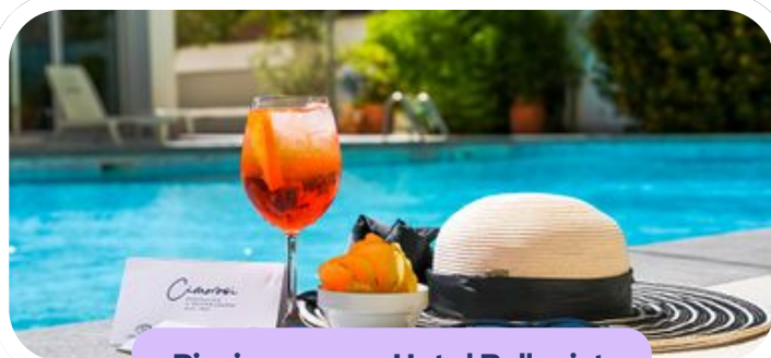
Piscina presso Hotel Bellavista